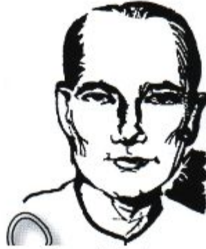
চিত্র: রাধারমণ দত্ত

সাধক কবি রাধারমণ দত্ত ছিলেন বীরভূম জেলার অধিবাসী চক্রপাণি দত্তের বংশোদ্ভূত। চক্রপাণি দত্ত ছিলেন তৎকালীন যুগের সবচেয়ে বড়ো পণ্ডিত। চক্রপাণি দত্ত সিলেটের রাজা প্রথম গোবিন্দকেশব দেব (ভাটেরা সাম্রাজ্যের অনুযায়ী ১০৪৯ খ্রিস্টাব্দে) এর চিকিৎসার জন্য তিন পুত্রসহ সিলেটে আসেন। পরবর্তীকালে তার দুই পুত্র সিলেটে থেকে যান কিন্তু তিনি জ্যেষ্ঠপুত্রসহ বীরভূমে ফিরে যান। আর এভাবেই চক্রপাণি দত্তের বংশধরেরা পরম্পরায় সিলেটে বসবাস করতে থাকেন।