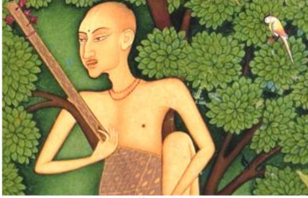
চিত্র: স্বামী হরিদাস