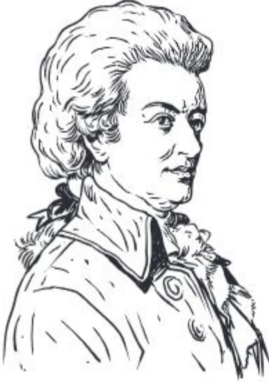
চিত্র: উলফগ্যাং আমাদিউস মোজার্ট

ক্লাসিক্যাল যুগের অতুলনীয় প্রতিভার অধিকারী একজন সংগীতকার। তিনি ১৭৫৬ সালের জানুয়ারি মাসের ২৭ তারিখ জন্মগ্রহণ করেন তাঁর পূর্ণনাম উলফগ্যাং আমাদিউস মোজার্ট। তিনি ৬০০ এর অধিক সংগীত রচনা করেন। অস্ট্রিয়ার সাল্টসবুর্গ শহরে খ্যাতিমান সংগীত শিক্ষক লিওপোল্ড-এর গুঁরসে তার জন্ম। বিস্ময়কর এই প্রতিভা মাত্র তিন বছর বয়সে পিয়ানোতে কঠিন সুর বাজাতে সক্ষম হয়েছিলেন। পাঁচ বছর বয়সে তার সংগীত শিক্ষা শুরু হয়। অল্প দিনের মধ্যেই হাপসিকর্ড বাজাতে শেখেন এবং ছোটো ছোটো অথচ চমকপ্রদ মিনিউয়েট রচনা করতে সমর্থ হন। বারো বছরের আগেই তিনি চিত্তাকর্ষকভাবে বেহালা, অর্গান প্রভৃতি বাজানোর দক্ষতা অর্জন করেন। তের বছর বয়সে তিনি ইতালি ভ্রমণ করেন। সেখানে রোমের এক গীর্জায় একটি ধর্মীয় স্তোত্রসংগীত একবার শুনে সেটিকে