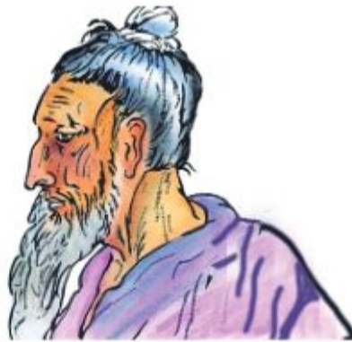
চিত্র: লালন সাঁই